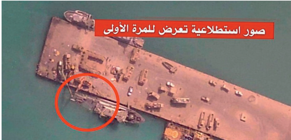
MHC Al-Qasnah (clase Frankenthal) en Moca (Yemen) el 29 de julio de 2017.