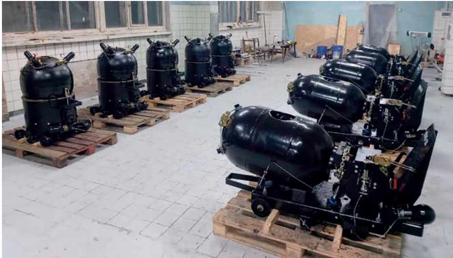
Minas YaM y KPM ucranianas tras su modernización en 2020.