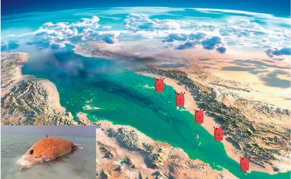
Puntos reales de minado en el mar Rojo y fotografía de una ballena muerta por la explosión de una mina.