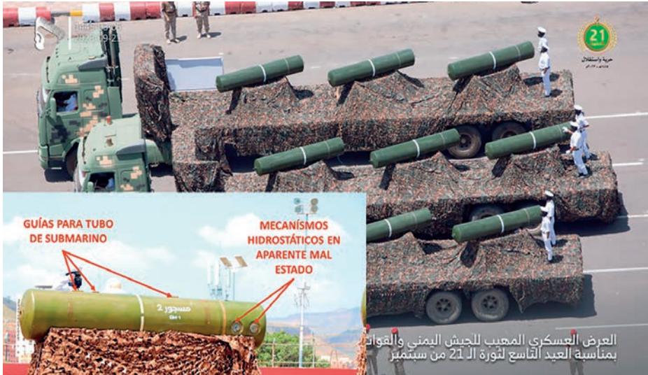
Minas DM-1 hutíes exhibidas durante la parada militar por la celebración de la Revolución de 2014.