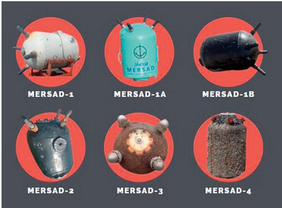
Variantes de la mina de contacto hutí Mersad.

Aunque el riesgo de minas navales en este conflicto hasta ahora parece limitado debido a la proximidad de los campos minados a la costa y por el explosivo relativamente pequeño de las Mersad, esta suposición pudiera ser errónea, ya que los hutíes cuentan además con minas de fondo de influencia de origen ruso AMD-500 (450 kg equivalentes en TNT) y DM-1 (1.125 kg equivalentes en TNT). El peligro generado por éstas es muy superior al de las Mersad, pudiendo ser fondeadas hasta los 125 m de sonda.