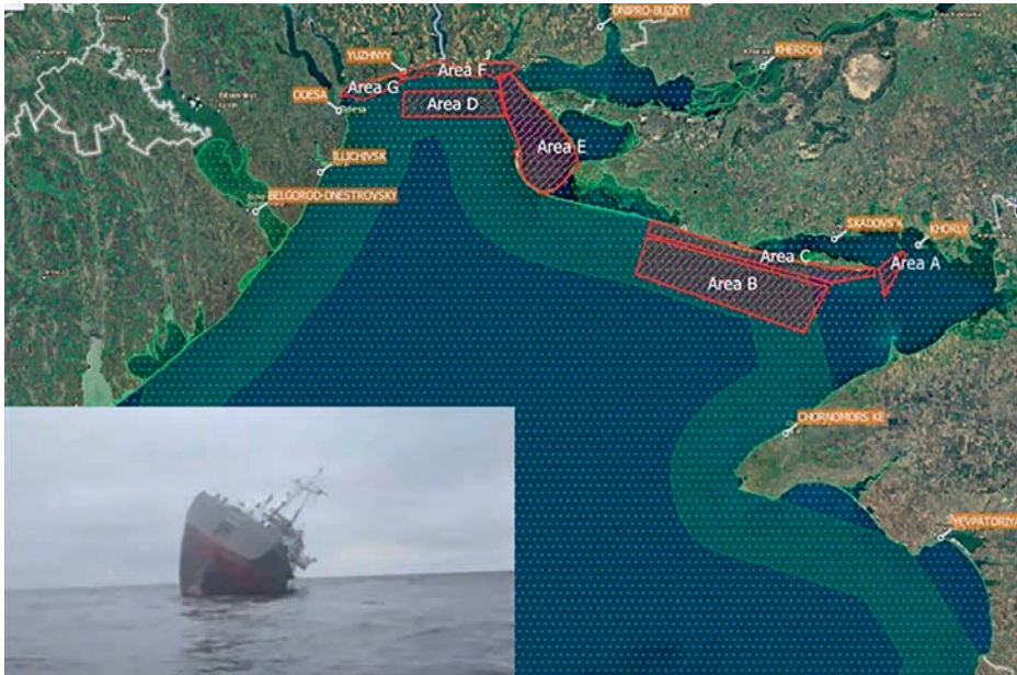
Áreas declaradas minadas por Ucrania y el MV Helt hundiéndose. (Elaboración propia a partir de https://shipping.nato.int )