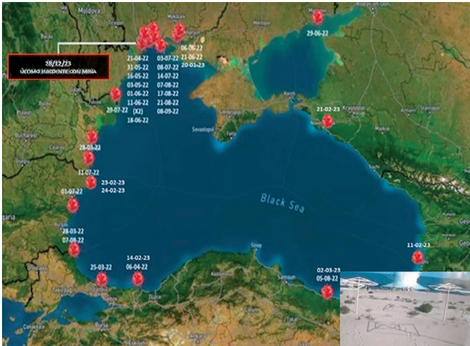
Incidentes con mina en el mar Negro y fotografía de la explosión de una mina producida por bañista. (Elaboración propia a partir de EosRisk twitter )

La mayoría de estos sucesos se han producido por explosiones de minas a la deriva, afectando no sólo al tráfico marítimo, sino a las costas adyacentes, pues éstas han detonado en playas, muelles, restaurantes e incluso por algún bañista inconsciente que, pese a estar prohibido el baño, se acercó a observar la mina, con fatal desenlace.