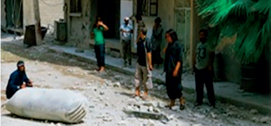
Mina rusa MDM-2 utilizada como IED en Siria.