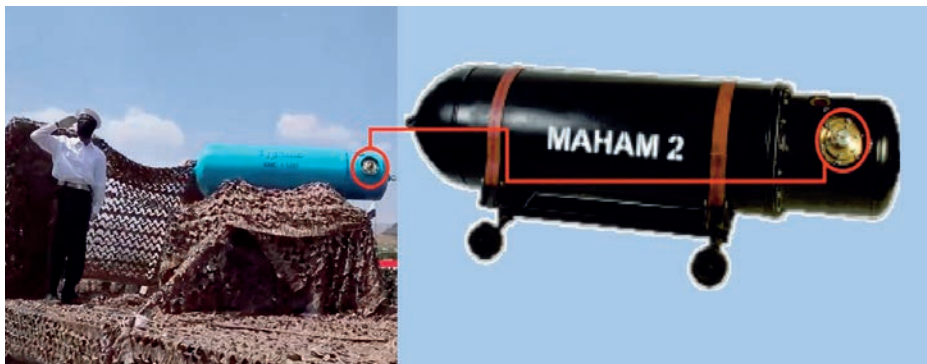
Mina AMD-1-500 hutí (izquierda) y la versión iraní Maham 2 (derecha).